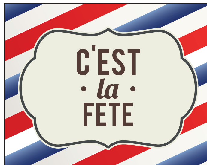
Contours bouteilles - Imprimez sur du papier ordinaire puis coller sur vos bouteilles