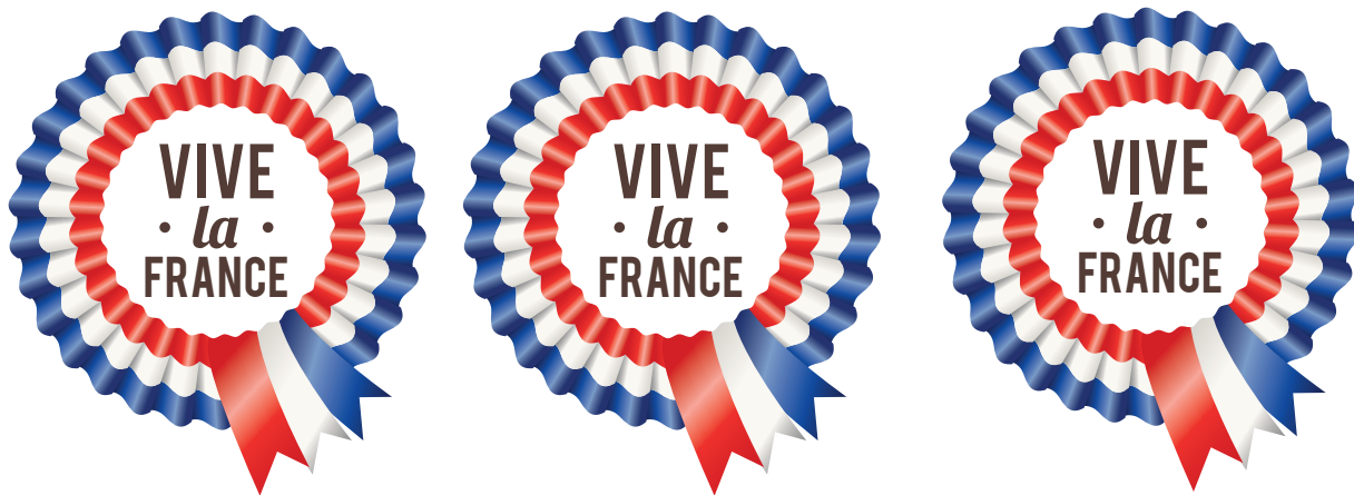
Toppers - A découper puis à coller sur des petits piques en bois